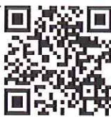
鹿児島県レク協会

この「RECREATION かがしま」も, 予定通り年3回発行することができました。来年度も, 更に内容の濃い誌面ができたと思っていますので, 広報誌についての御意見, 御要望等がありましたら, 是非, お聞かせください。来年度もよろしくお願いします。